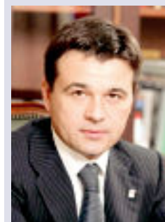
Предварительное голосование пройдет на 800 площадках по всей стране. «Единороссы» предполагают, что за 600 мест в избирательном списке партии захотят побороться около пяти тысяч человек.

бинат), а также 202 физических лица, присоединившихся к Народному фронту. А в целом по области будет 3598 выборщиков — это уважаемые, известные люди, которым доверено право давать оценку предвыборным программам кандидатов праймериз.