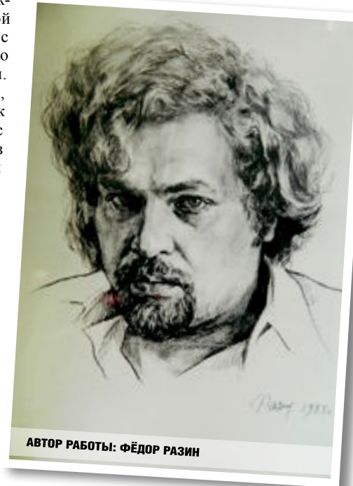
АВТОР РАБОТЫ: ФЁДОР РАЗИН

Ты в памяти останешься такой же, Какой придумал и какой любил... Пусть это было странным сном, Но всё же – Приснилось мне, что я счастливым Был!