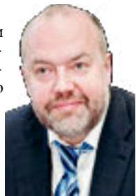
Павел КРАШЕНИННИКОВ, председатель Ассоциации юристов России, Комитета по гражданскому, уголовному, арбитражному и процессуальному законодательству ГД РФ

Поздравляю с нашим праздником, Днём юриста! Уверен, в Магнитке работают настоящие профессионалы, для которых верховенство закона является абсолютной ценностью и смыслом. В этот праздничный день нам надо признать: чтобы последовательное в правовом плане поведение стало нормой для граждан и организаций, сделать необходимо многое. Именно потому особые слова благодарности позволяют адресовать тем представителям юридического сообщества, кто находит время и силы для общественной, просветительской деятельности в сфере правовой помощи.