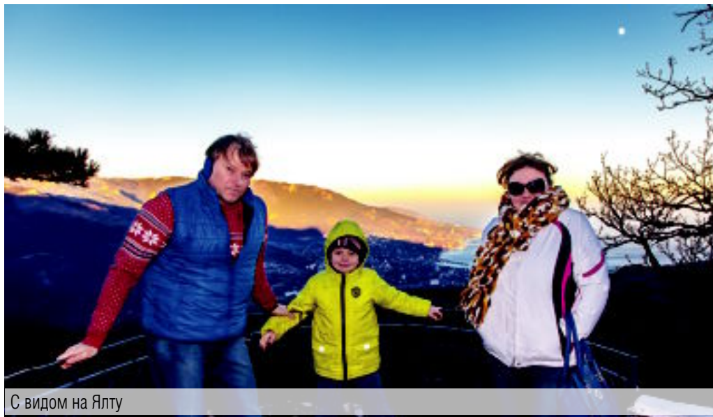
С видом на Ялту