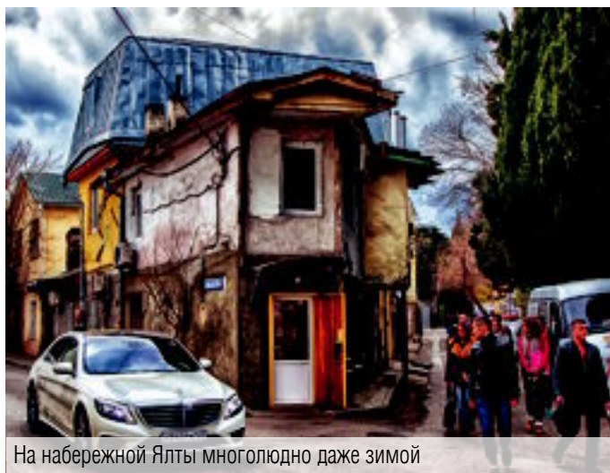
На набережной Ялты многолюдно даже зимой