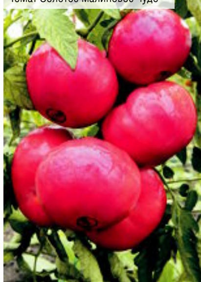
Томат Золотое малиновое чудо

Если кто-то подумал, что речь пойдет о сладких ягодах малины, то он глубоко ошибается. Мы будем говорить о цвете, нежном и насыщенном малиновом цвете самых вкусных помидоров.