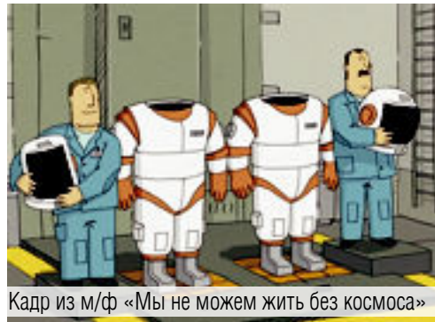
Кадр из м/ф «Мы не можем жить без космоса»