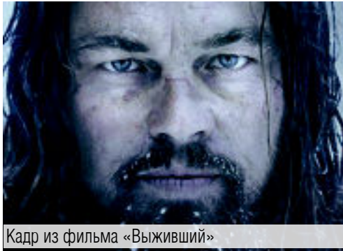
Кадр из фильма «Выживший»

Главные интриги списка номинантов на получение «Оскара»-2016