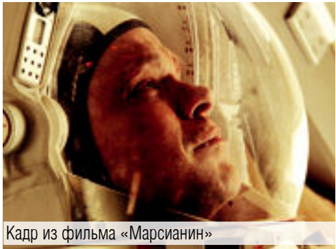
Кадр из фильма «Марсианин»