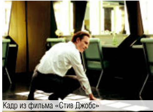
Кадр из фильма «Стив Джобс»