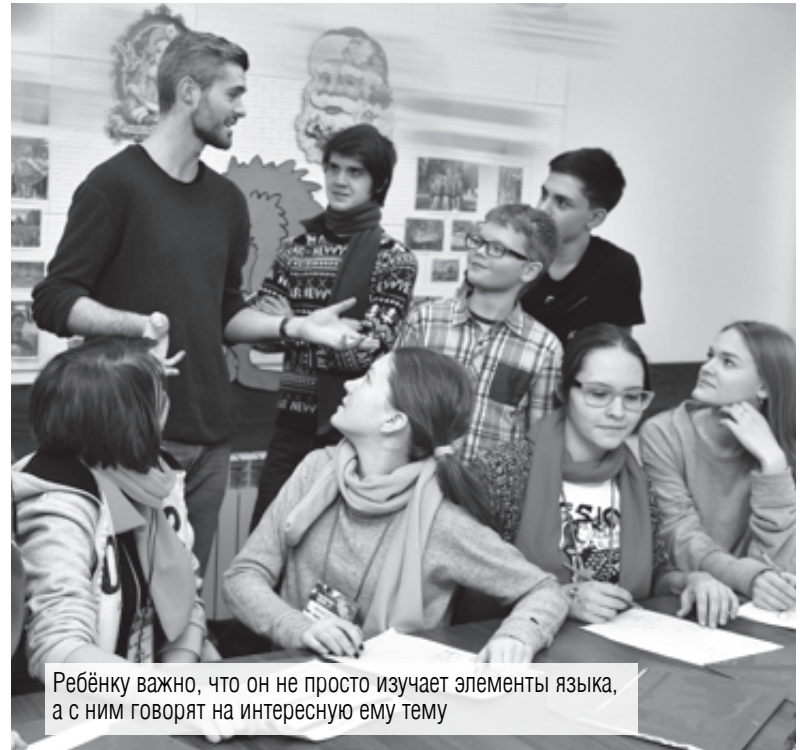
Ребёнку важно, что он не просто изучает элементы языка, а с ним говорят на интересную ему тему