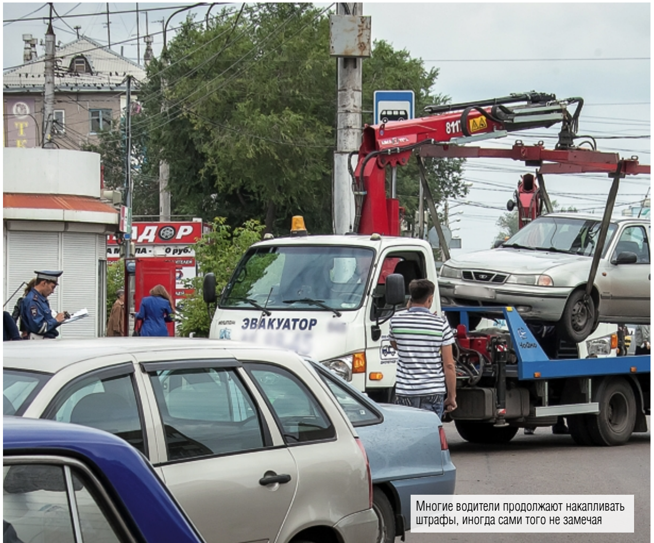
Многие водители продолжают накапливать штрафы, иногда сами того не замечая

Федеральная служба судебных приставов стала использовать новый метод борьбы с должниками