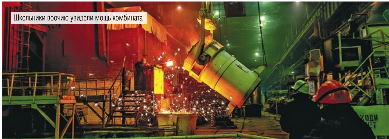
Школьники воочию увидели мощь комбината

Механоремонтный комплекс ПАО «ММК» активно участвует в социальном профориентационном проекте «Магнитогорск. Дело будущего»