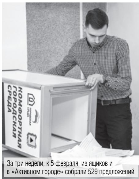
За три недели, к 5 февраля, из ящиков и в «Активном городе» собрали 529 предложений

Магнитогорцы предлагают общественную территорию, которую в 2019 году реконструируют по программе «Формирование комфортной городской среды». В Челябинской области программу при поддержке губернатора Бориса Дубровского реализуют с 2017 года. В электронном виде мнениями делятся на портале «Активный город», на бумаге – в муниципальных администрациях. Городские и районные власти принимают предложения до 15 февраля.