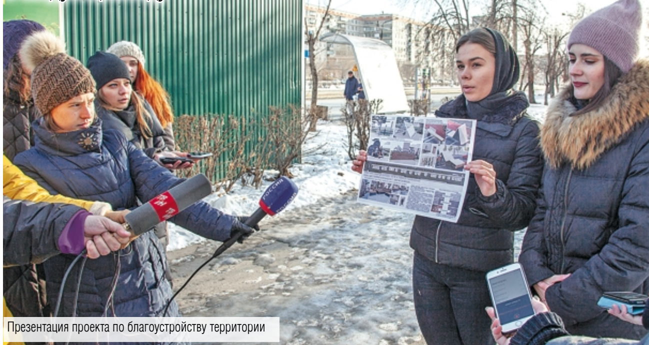
Презентация проекта по благоустройству территории

Магнитогорцы решат, будет ли продолжено его благоустройство в следующем году