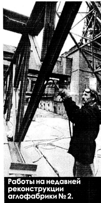
Работы на недавней реконструкции аглофабрики № 2.