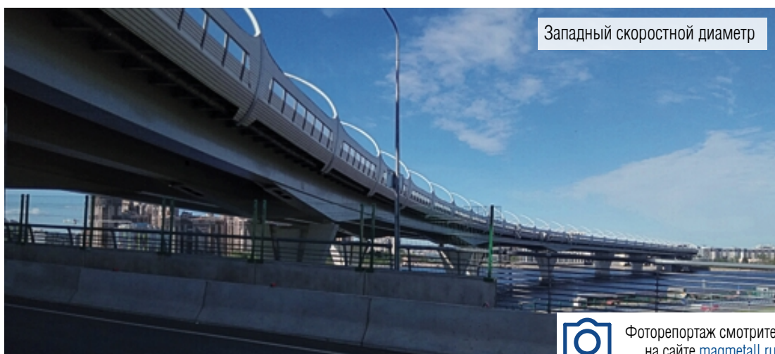
Западный скоростной диаметр

Многие могут похвастаться, что бывали в Санкт-Петербурге, и не один раз. Мои посещения города на Неве можно сосчитать на пальцах одной руки. Но достаточно единожды подышать воздухом Северной столицы, чтобы понять, почему он особенный.