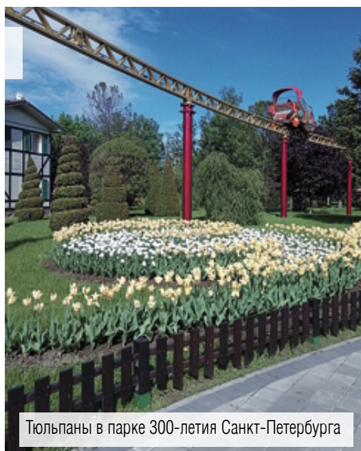
Тюльпаны в парке 300-летия Санкт-Петербурга