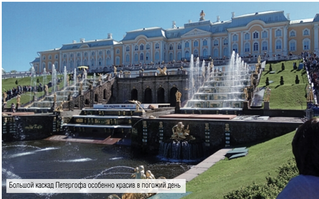
Большой каскад Петергофа особенно красив в погожий день

В поездках, даже в места, где уже бывал, всегда можно открыть что-то новое