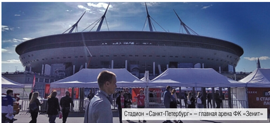
Стадион «Санкт-Петербург» – главная арена ФК «Зенит»