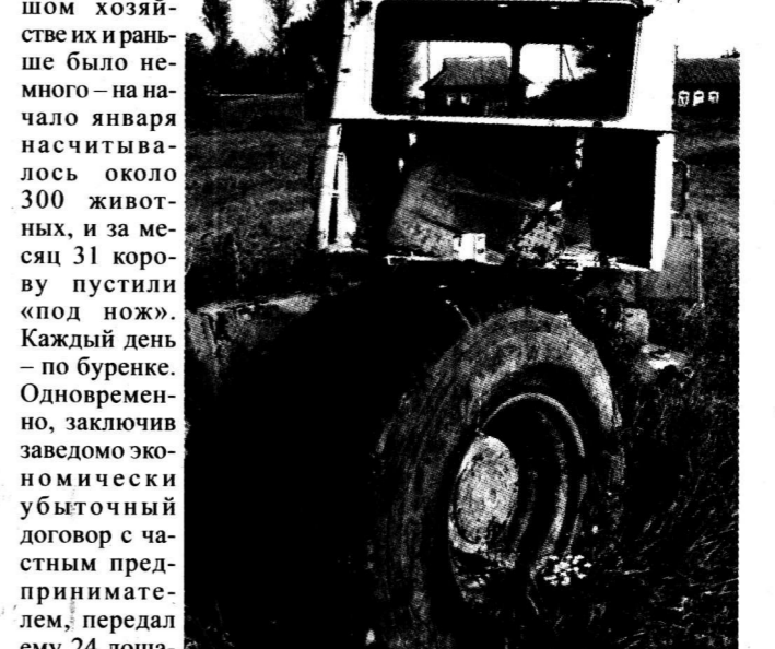
Там, где нет хозяина...