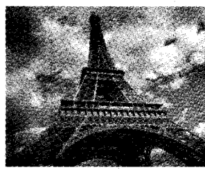
Наши студенты показали себя во французской стороне

№ 124 (11472) 1 ноября 2005 года ВТОРНИК