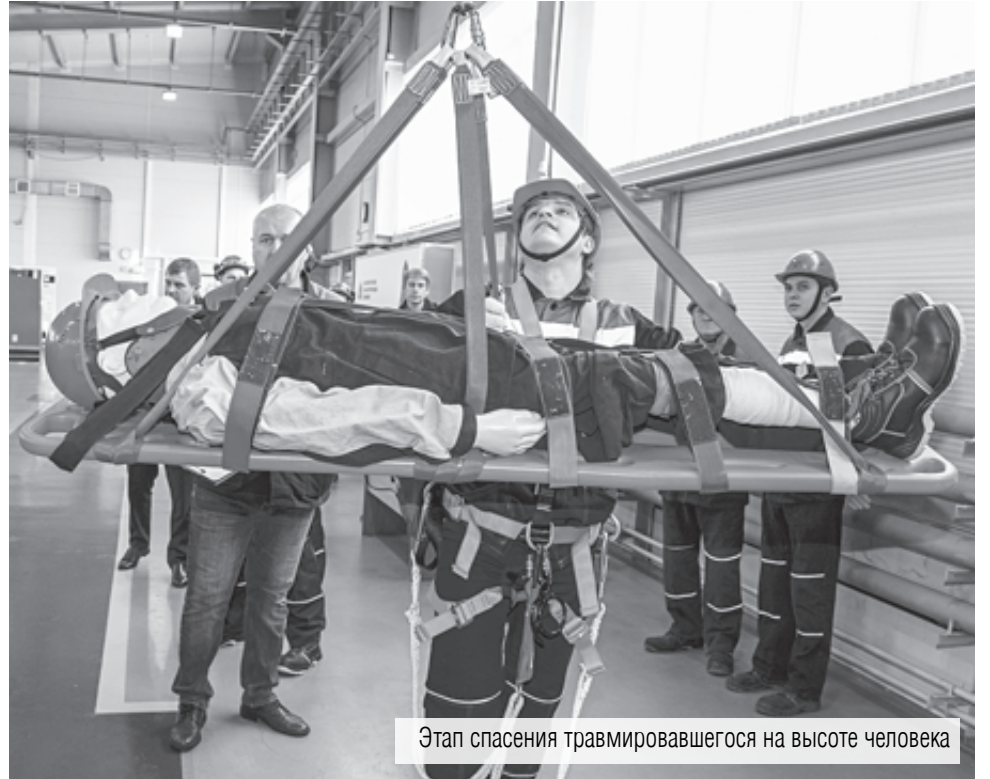
Этап спасения травмированного на высоте человека