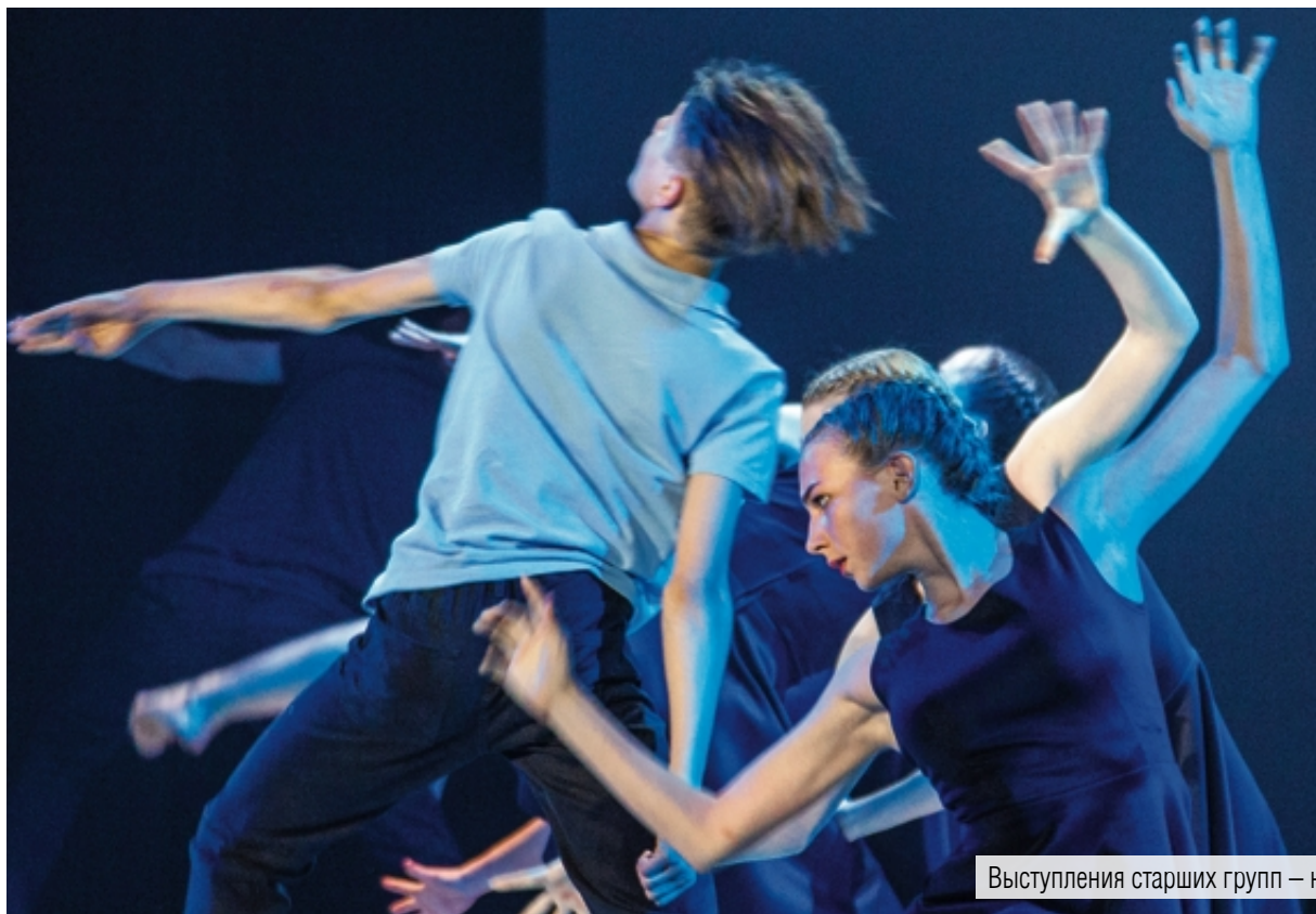
Выступления старших групп – настоящие театрализованные представления, наполненные глубоким смыслом