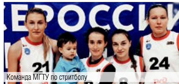
Команда МГТУ по стритболу