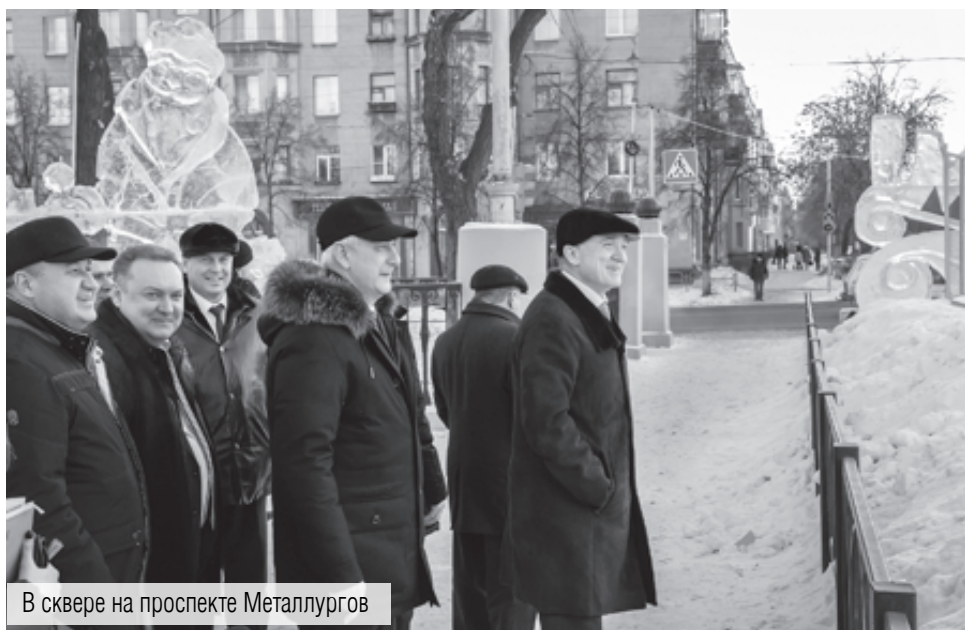
В сквере на проспекте Metallургов