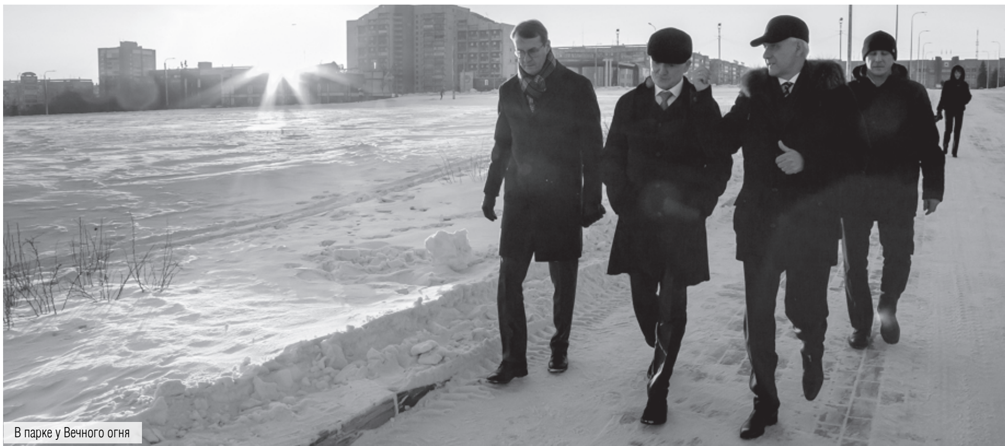
В парке у Вечного огня