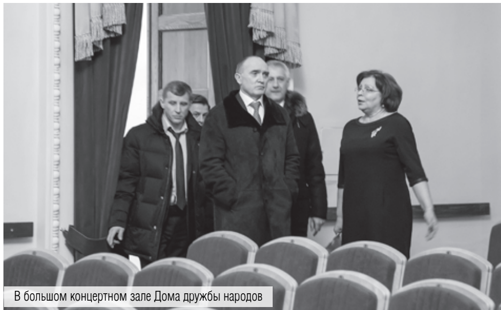
В большом концертном зале Дома дружбы народов