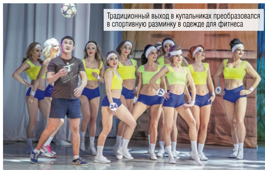
Традиционный выход в купальниках преобразовался в спортивную разминку в одежде для фитнеса