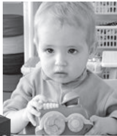
Денис Х. (июль 2011)

Девочка умеет самостоятельно одеваться. Усидчивая, но предпочитает играть в одиночестве. В активной речи отдельные слова. Понимает обращенную к ней речь. Детей в группе знает по именам. Любит музыкальные занятия.