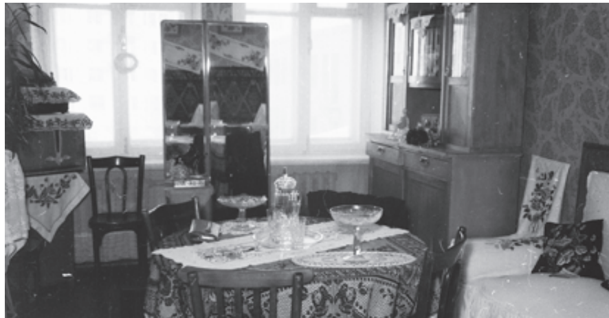
Ещё больше фото смотрите на сайте vk.com/magnitogorskoldfoto Магнитогорск. Тайна старой фотографии