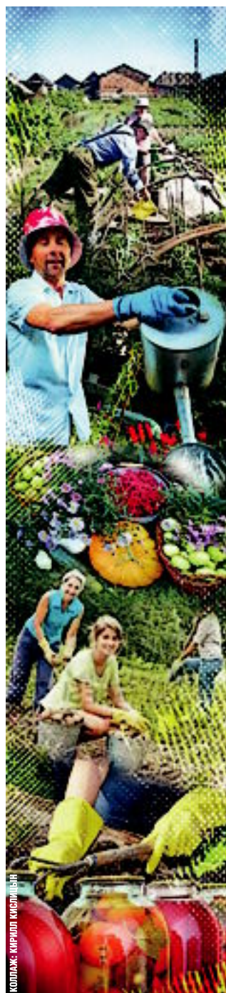
КОПИЛОНС КАРПОП МЕДИЯ

Экспозиция представит несколько разделов: индивидуальное домостроение, деревообработка, архитектура и дизайн, декор, товары для дома и интерьера, бани, бассейны, спортивные и игровые площадки и многое другое. В рамках выставки пройдут семинары, презентации, «крутые столы». Гостей ждёт много нужной и полезной информации. В частности, можно будет познакомиться с новым малоэтажным жильём комплекса города и уникальными материалами, такими, например, как ламинат под кожу крокодила.