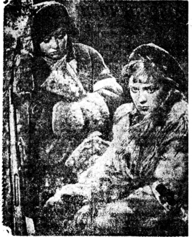
Кадр из фильма «Подруги»

ВСЯ МОЛОДЕЖЬ ДОЛЖНА ВИДЕТЬ ЗАМЕЧАТЕЛЬНЫЙ ФИЛЬМ «ПОДРУГИ»