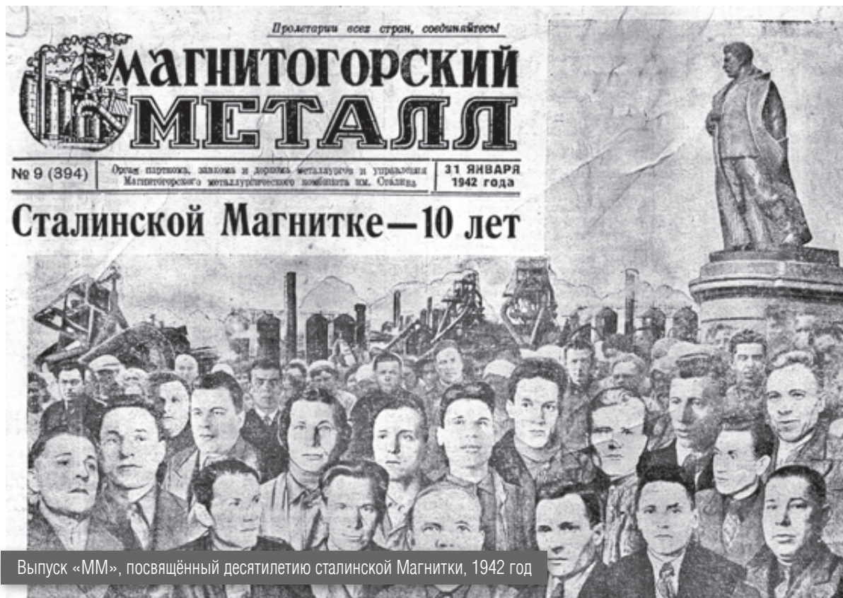
Выпуск «ММ», посвящённый десятилетию сталинской Магнитки, 1942 год