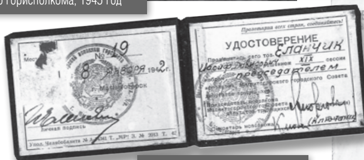
Удостоверение председателя Магнитогорского горисполкома