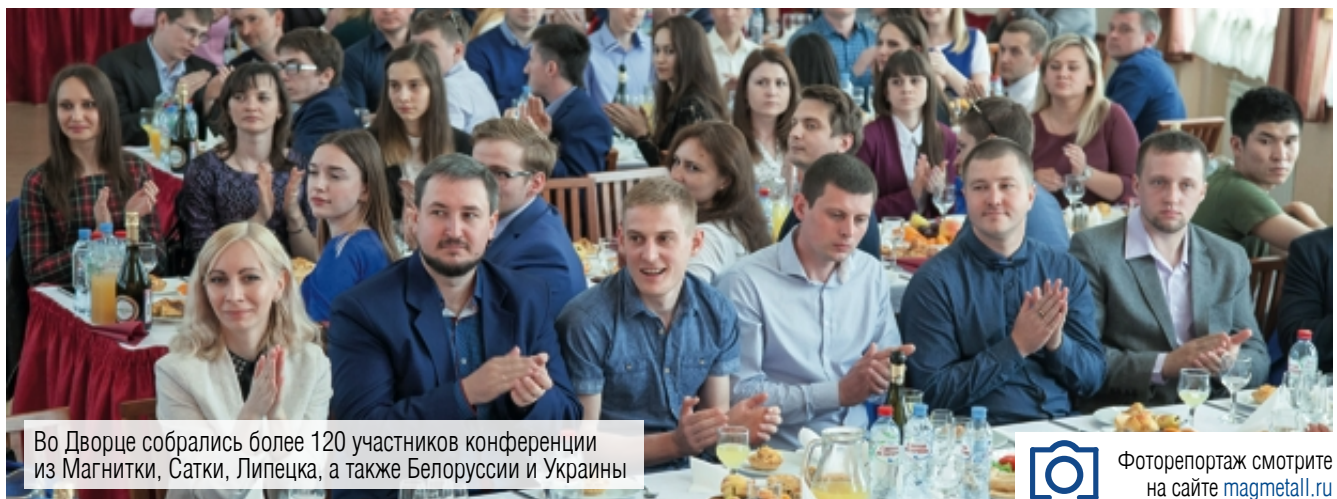
Во Дворце собрались более 120 участников конференции из Магнитки, Сатки, Липецка, а также Белоруссии и Украины