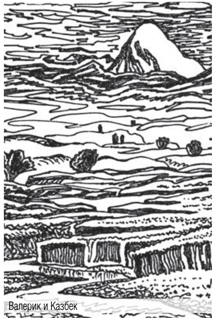
Валерик и Казбек