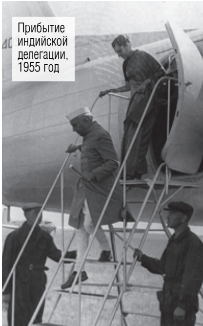
Прибытие индийской делегации, 1955 год

Полосу укатывали прямо по травяному покрову, а готовность проверяли нестандартно: пустив автомашину с грузом. Кроме того, не было оборудованных стоянок и пассажирских трапов для этих самолётов. В результате их изготовили в одном из цехов ММК. В то время аэродром «Зелёное поле» не имел союзного значения. Рейсы по центральному