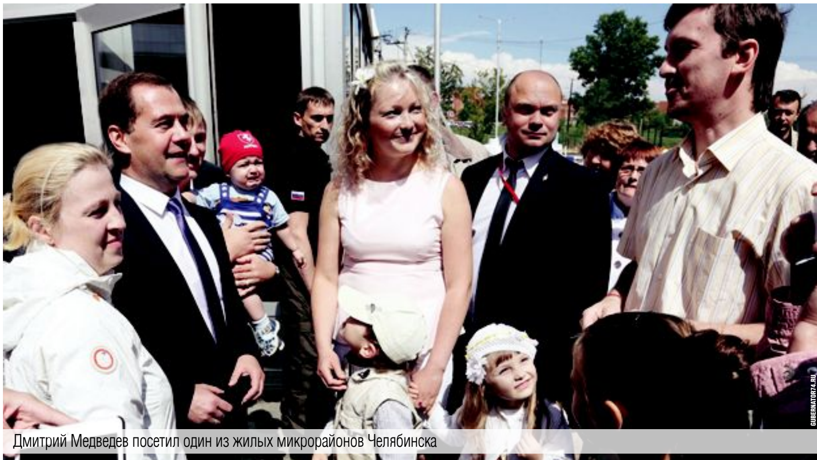
Дмитрий Медведев посетил один из жилых микрорайонов Челябинска