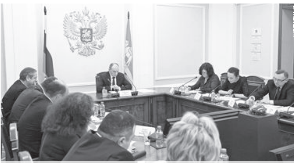
Губернатор о работе чиновников с бизнесом: «Играйте по правилам или не будете играть вообще»

отчитались перед Дубровским о количестве проведённых проверок. Однако никто из них так и не смог дать ответ на вопрос губернатора: влияет ли эта работа на реальное положение дел; может ли бизнес в Челябинской области «дышать полной грудью»? «Мы все с вами ждём какого-то мифического миллиардера, который придет и проинвестирует в экономику Челябинской