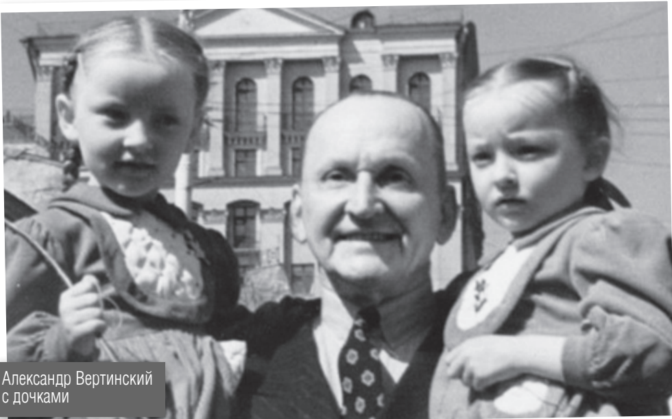
Александр Вертинский с дочками