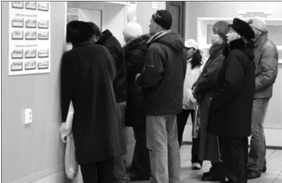
Выдают готовые документы в течение всего рабочего дня

ВСЕ УПЕРЛОСЬ в пресловутую госпошлину: ну ни в одной сберкассе не желали принимать 400 рублей за загранпаспорт.