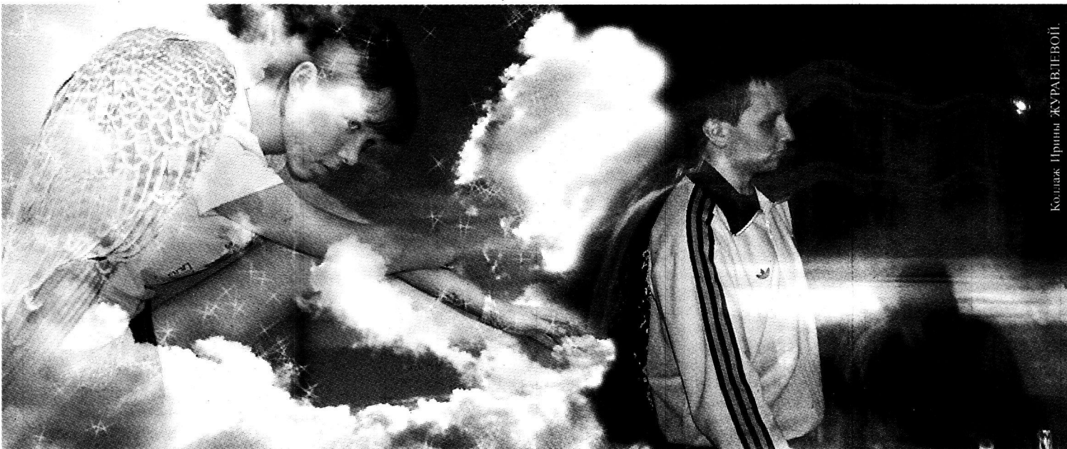
Коллаж Ирина ЖУРАВЛЁВА

В голове его была абсолютная пустота. Да он и думать ни о чем не хотел – и так все было ясно. И только пока непонятная радость начала потихоньку, волнами, подниматься из глубины его души, объяснение которой он вскоре понял: он не успел, он не успел ничего сделать! И увидел этого ребенка прежде, чем достал нож. На какой-то момент бывший солдат почувствовал себя Богом. И не из-за того, что только что подарил кому-то жизнь, а потому, что научился прощать.