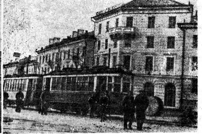
За три года, прошедшие со дня предыдущих выборов в местные Советы, до неузнаваемости изменился облик нового города Сталинской Магнитки на правом берегу Урала. На прежних пустырях возникли великолепные жилые дома и здания культурных учреждений, образуя красивые улицы, архитектурно оформленные площади. На снимке (слева направо): в фойе недавно открытого кинотеатра, средняя школа и уголок Комсомольской улицы.