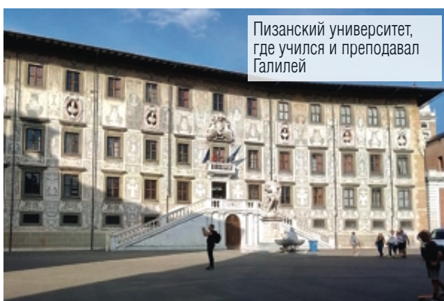
Пизанский университет, где учился и преподавал Галилей