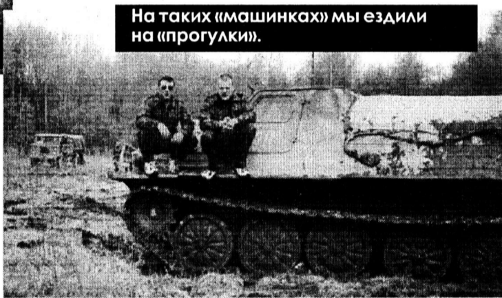
На таких («машинках») мы ездили на «прогулки».

Хотели мы в этот день устроить праздничную демонстрацию с патристическими песнями, но нас опередили военные из академии, работающие на вахте в качестве саперов. Соблюдая все меры предосторожности, они из найденных на месте боев снарядов устроили нам что-то наподобие праздничного салюта.