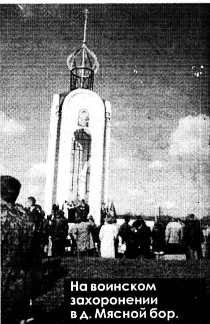
На воинском захоронении в д. Мясной бор.

Л. ЩЕРБИНА. Магнитогорск — Мясной бор — Новгород — Магнитогорск.