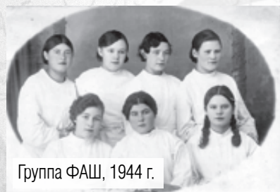
Группа ФАШ, 1944 г.

• По итогам зимней сессии Магнитогорская фельдшерско-акушерская школа (ФАШ) заняла первое место среди медицинских школ Челябинской области, добившись абсолютной успеваемости 99 процентов и качественной – 73 процента. 117 учащихся школы – отличники.