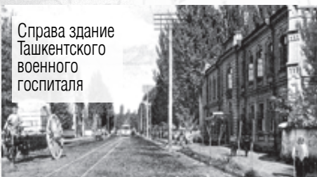
Справа здание Ташкентского военного госпиталя