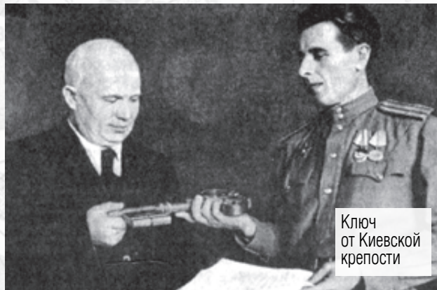
Ключ от Киевской крепости