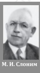
М. И. Слоним