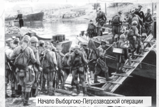
Начало Выборгско-Петрозаводской операции

• Началась Выборгско-Петрозаводская стратегическая наступательная операция войск правого крыла Ленинградского фронта Л. А. Говорова и левого крыла Карельского фронта К. А. Мерецкова во взаимодействии с Балтийским флотом, Ладожской военной флотилией и Онежской флотилией, продолжавшаяся до 9 августа 1944 года.