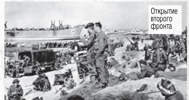
Открытие второго фронта

• В результате высадки англо-американских войск в Нормандии – Нормандской десантной операции под кодовым наименованием «Оверлорд» – был открыт второй фронт. По масштабу и количеству участвовавших сил и техники это была крупнейшая десантная операция второй мировой войны.