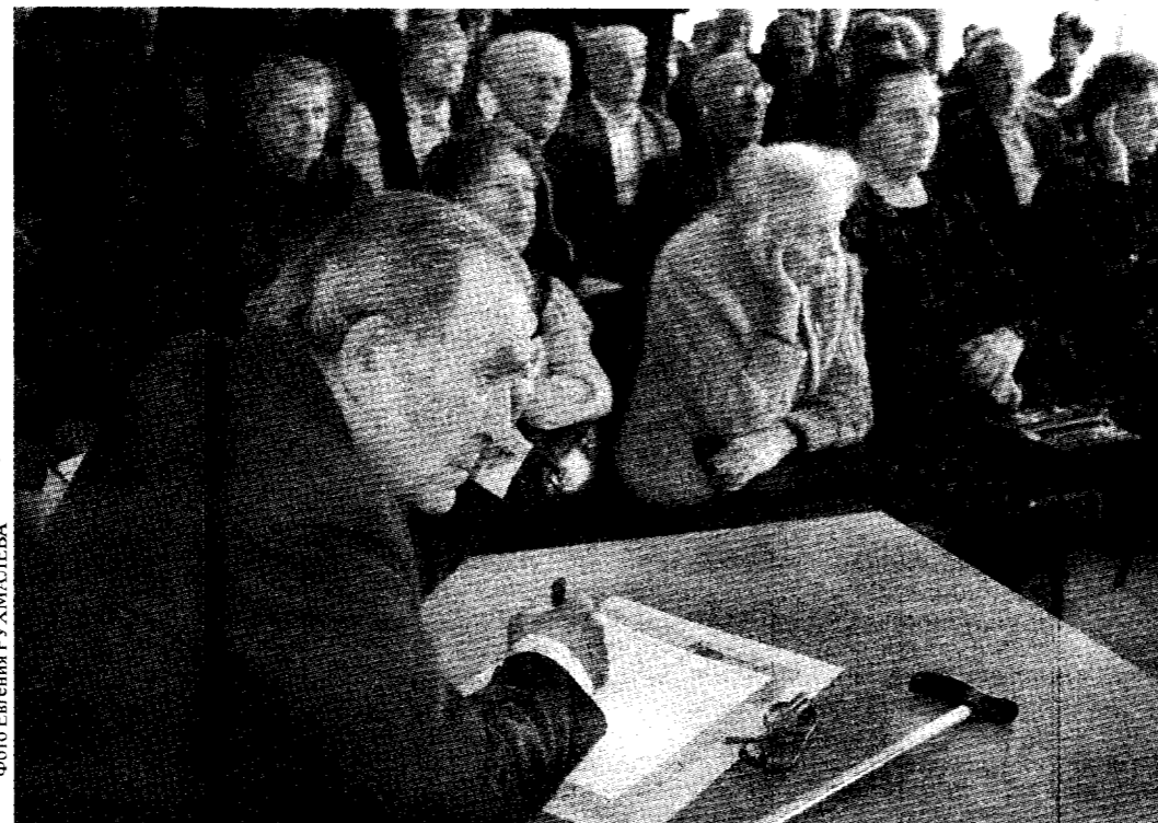
Здравомыслие и мудрость — черты коммунистов Магнитки.