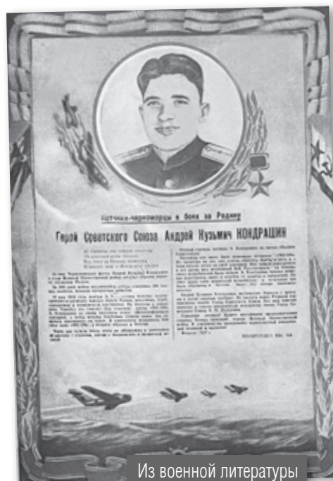
Из военной литературы