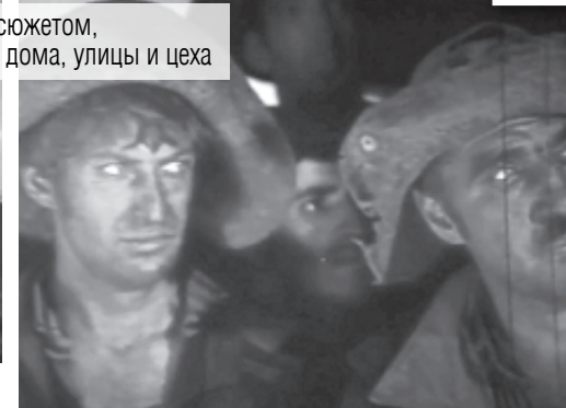
Газета «Магнитогорский металл» от 8 июля 1982 г.

29 и 30 июня на экране кинотеатра «Современник» был организован показ фильма, которого с нетерпением ждали все магнитогорцы. Это «Предисловие к битве». Интерес, вызванный этим фильмом, не случаен. Съёмки его, начавшиеся ровно год назад, проходили у нас в городе, на нашем комбинате. Причем многие магнитогорцы, металлурги принимали в них самое непосредственное уча-