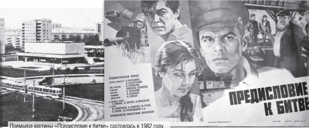
Премьера картины «Предисловие к битве» состоялась в 1982 году. В кинотеатре «Современник» в день показа было не протолкнуться