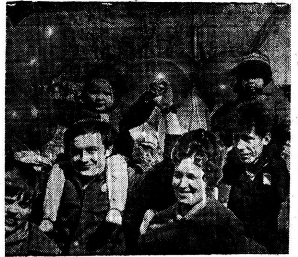
ФОТОРЕПОРТАЖ Н. ЦЕСТЕРЕНКО.

КОГДА по праздничным улицам города шли колонны демонстрантов, во всех цехах и переделах комбината бригады и смены, заступившие в тот день на трудовую вахту, вносили на сверхплановый счет месяца первые записи. Успехи первых смен месяца закреплялись и закрепляются в последующие дни. Об этом наглядно свидетельствуют поступающие в редакцию сообщения из цехов.