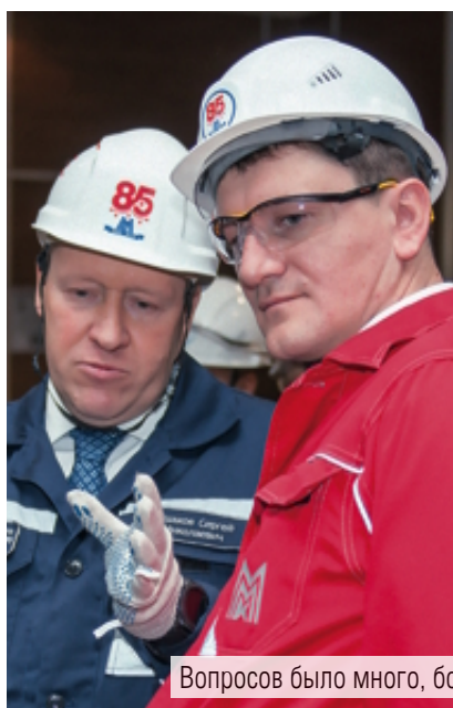
Вопросов было много, большая их часть касалась качества и цены магнитогорского проката