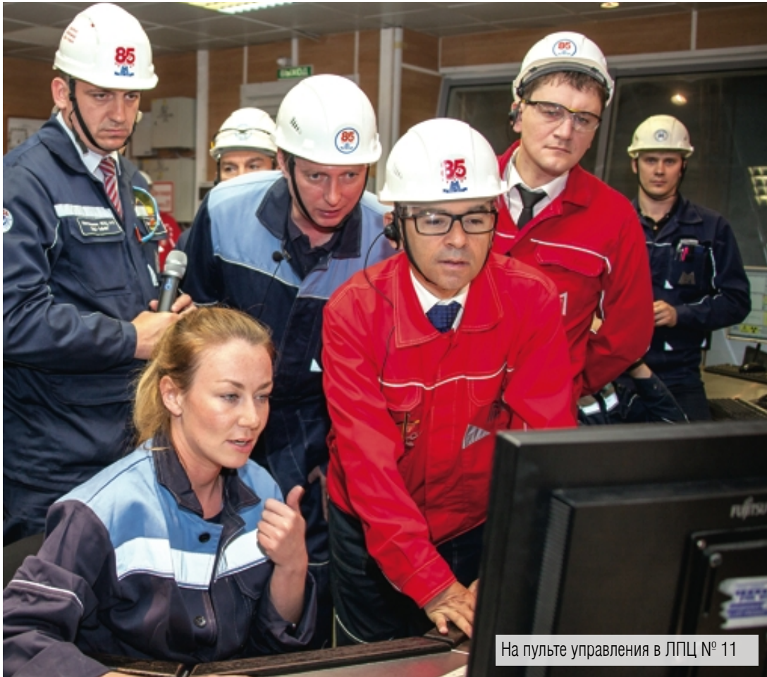
На пульте управления в ЛПЦ № 11