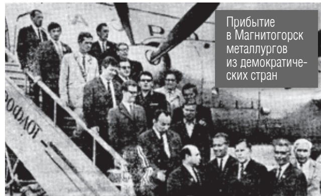
Прибытие в Магнитогорск металлургов из демократических стран