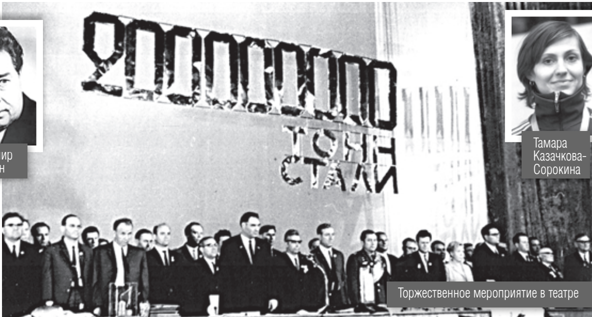
Торжественное мероприятие в театре