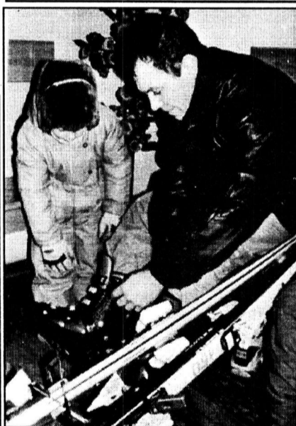
Перед выходом на трассу.

Первую попытку выехать с одной из бригад управления железнодорожного транспорта ОАО «ММК» в горнолыжный центр «Абзаково» я предпринял еще в позапрошлую пятницу. Но, увы, желающих отдохнуть в горнолыжном центре в службе погрузки-выгрузки набралось всего пять-шесть человек, и я с ними не поехал. Решил отправиться в Абзаково с другой группой металлургов — коллективами первой и четвертой бригад кислородно-конвертерного цеха.