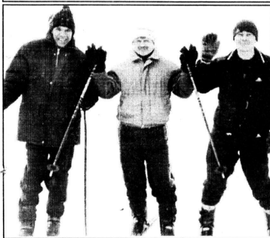
Все было здорово.