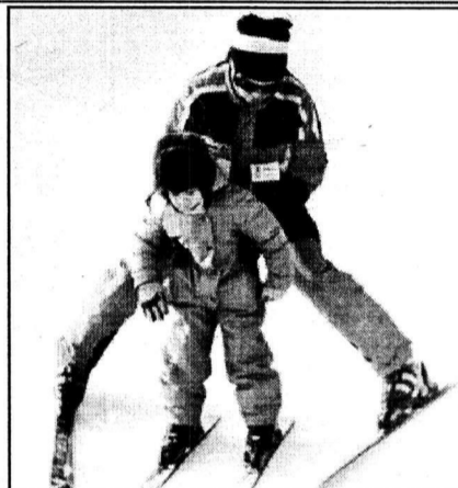
В первый раз с тренером...