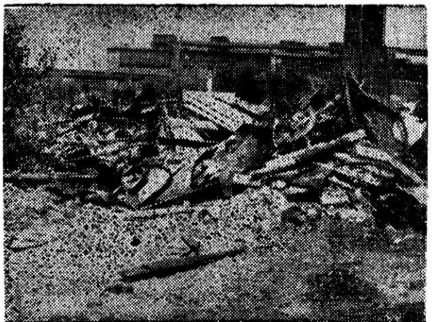
Так выглядит территория листопркатного цеха со стороны термического отделения.