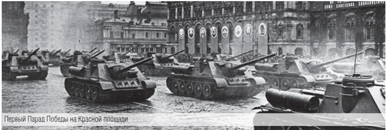
Первый Парад Победы на Красной площади

День Победы – особое, одновременно радостное и горькое торжество стало неотъемлемой частью истории каждой российской семьи