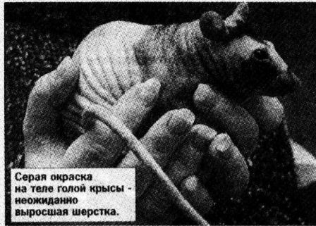
Серая окраска на теле голых крыс - неожиданно выросшая шерстка.