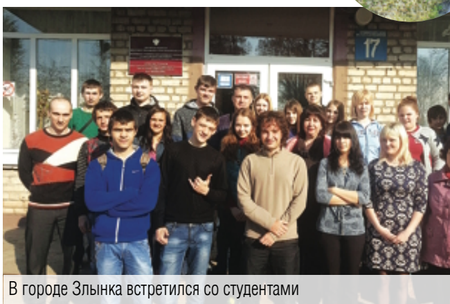
В городе Злынка встретился со студентами

Напомним, магнитогорец продолжает посвященный Дню Победы забег от Мамаева Кургана до Третьего парка.