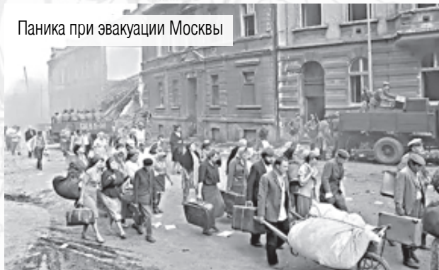
Паника при эвакуации Москвы

На ММК впервые в мировой практике удалось сварить броневую сталь в большегрузной мартеновской печи с основным подом. Броневая – это сталь, содержащая хром, никель и молибден, которые подвергают специальной термической обработке. Такой сплав обладает очень большой вязкостью и прочностью. Броня не должна ломаться при ударе снаряда со скоростью 200 метров секунду. Снаряд может прошить её насквозь, оставив в ней только дырку или, как говорят специалисты, пробку, но не трещины и осколки, которые могут повредить экипажу танка. Вязкость сплава давалась тяжелее всего. Наконец, после пробных плавок, 15 октября удалось сварить броневую сталь.