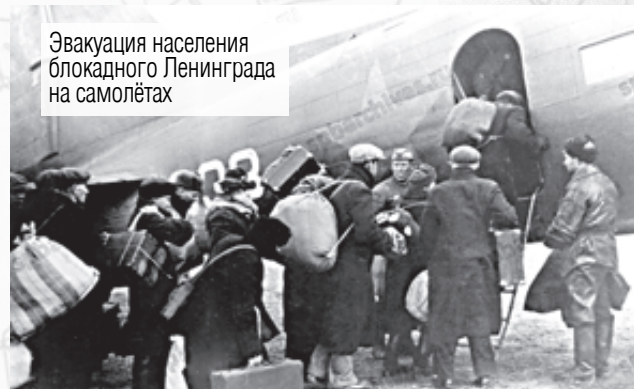
Эвакуация населения блокадного Ленинграда на самолётах

Немецкие войска оккупировали города Артёмово, Дзержинск, Константиновка, Славянск, Часов Яр Донецкой области.