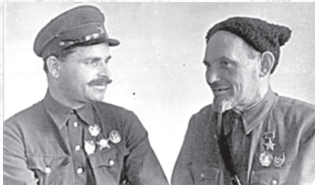
Семён Васильевич Руднев (слева) и Сидор Артемьевич Ковпак

В Сумской области объединились два партизанских отряда – под командованием С. В. Руднева и С. А. Ковпака. Командиром объединённого отряда стал С. А. Ковпак, комиссаром – С. В. Руднев.