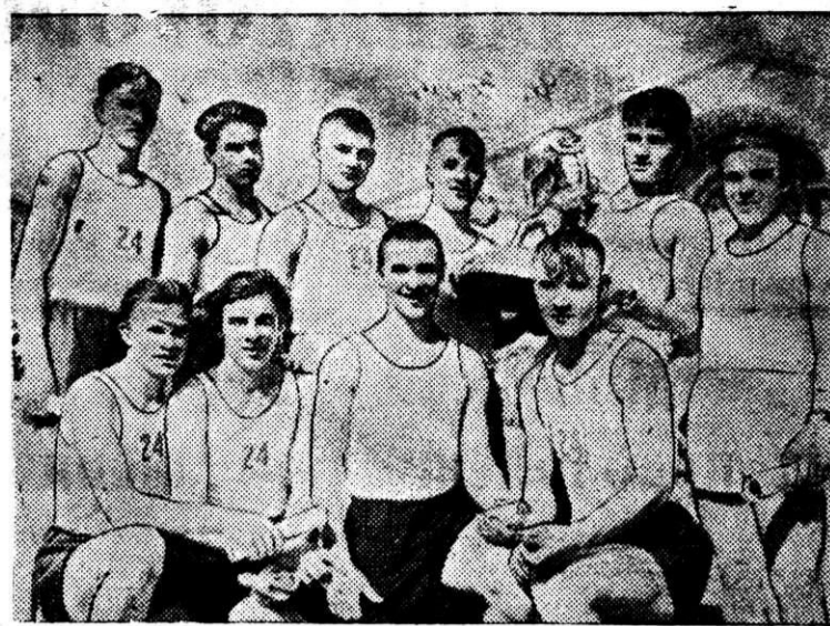
В минувшее воскресенье в Правобережном районе состоялась традиционная эстафета легкоатлетов молодежных общежитий города, в которой приняли участие более 20 мужских команд. Победу одержала команда интерната нашего комбината. На снимке: легкоатлеты команды интерната — победители в эстафете.